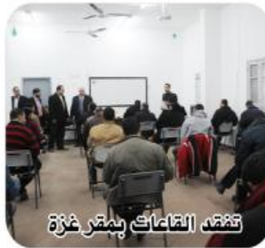
تفقد القاعات بمقر غزة