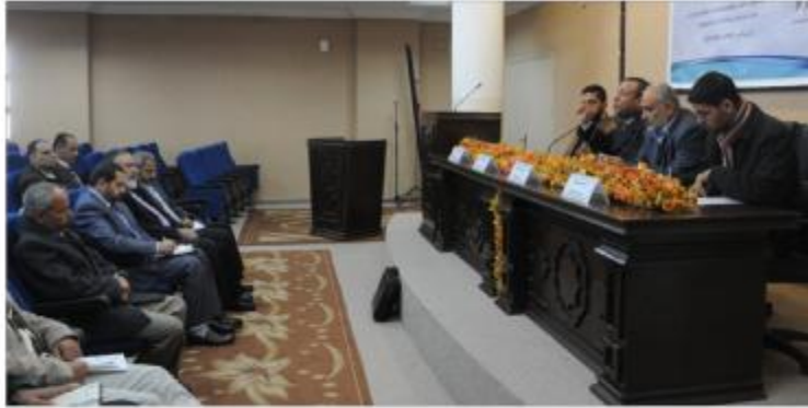
بمنهية زيارات تبادلية بين عمادات شؤون الطلبة وإنشاء اتحاد رياضي يضم كل الجامعات والكليات ، مع عقد ورشة عمل

حول تأثير مواقع التواصل الاجتماعي على الشباب الجامعي ، وإعداد تقرير فصلي حول أنشطة عمادات شؤون الطلبة في مؤسسات التعليم العالي بحضور : مدوخ وعدد من عمداء شؤون الطلبة ، ومثلي التوجيه والإرشاد في مؤسسات التعليم العالي وقد فتح باب النقاش والاستماع لآراء الحضور ووجهات نظرهم ، لتعزيز نقاط القوة وتفاذي الضعف إضافة للأفكار الإبداعية الجديدة التي من شأنها تطوير العمل والارتقاء به.