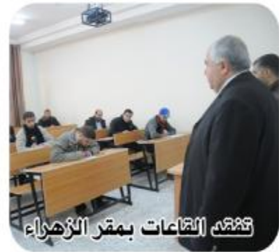
تفقد القاعات بمقر الزهره